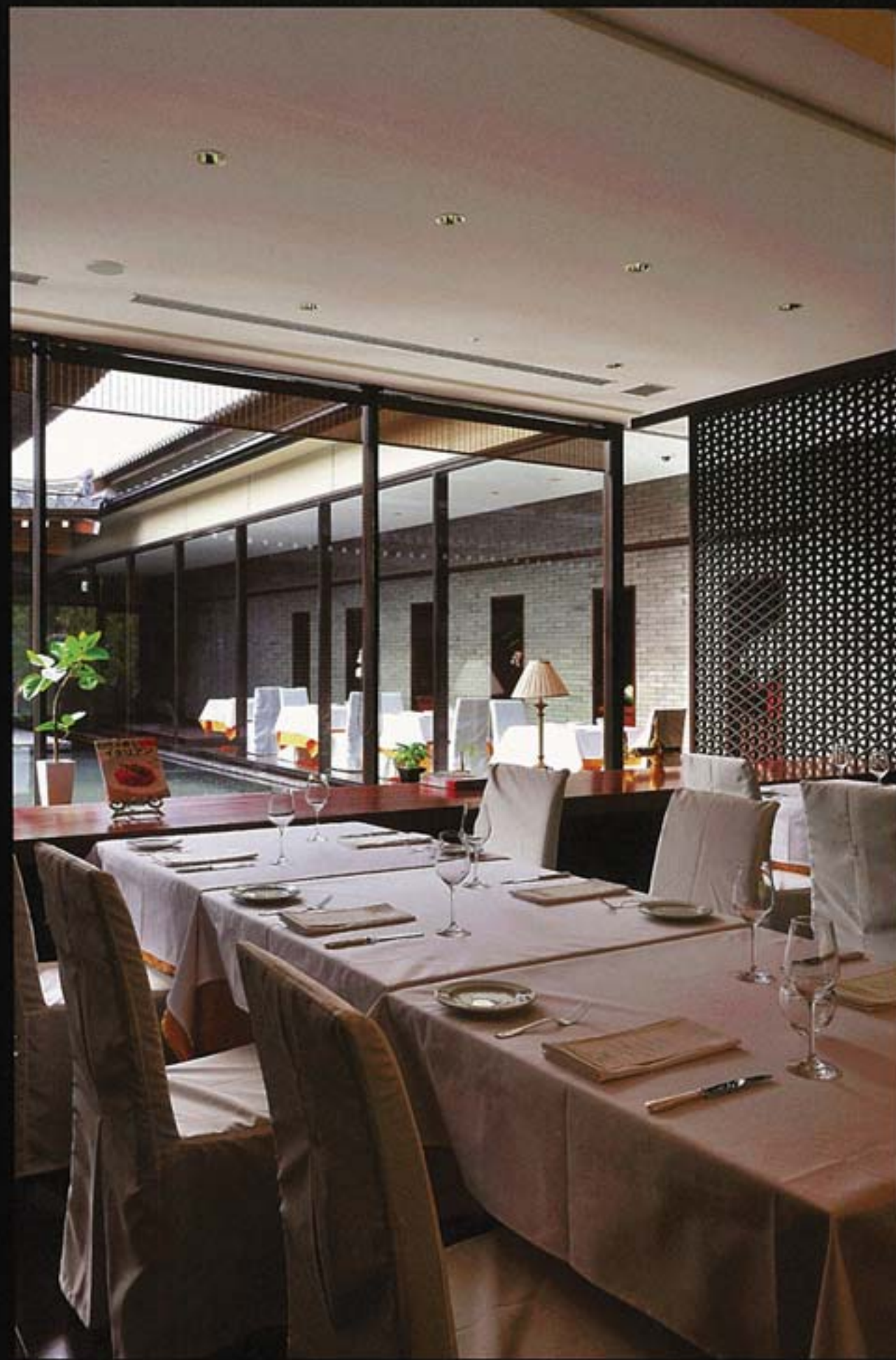
Ristorante Fenice di Aqua Pazza